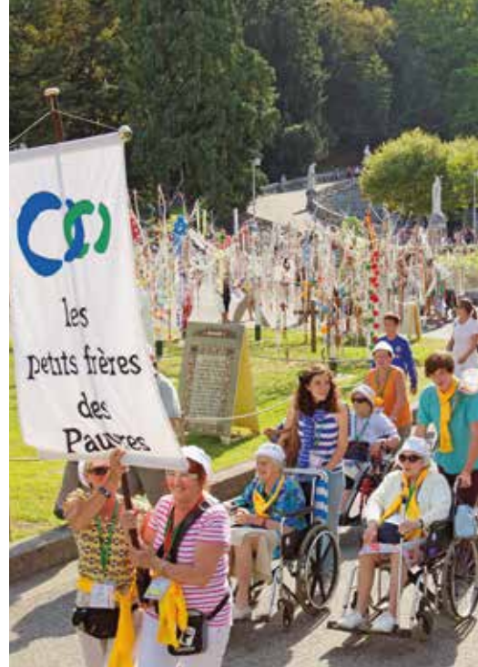
Pèlerins lors d'une procession.

■ ■ ■ Au commencement de l'histoire de la foi qui trouvera son accomplissement en Jésus Christ, il y a la confiance d'un homme, appelé à devenir le père d'une multitude d'hommes, impossible à dénombrer. Abraham avait reçu la promesse d'une descendance aussi nombreuse que les étoiles dans le ciel et que le sable au rivage des mers. Et Abraham a cru en Dieu. Il est devenu le père des croyants. De son sein et de sa foi est né un peuple, le peuple d'Israël dont l'aventure entre l'Égypte et la Terre promise est devenue le modèle de l'aventure spirituelle de l'humanité. Nous l'avons entendu en première lecture (cf. livre de l'Exode 14, 15-31 – 15, 1a) : le peuple est libéré de l'esclavage et de la mort en passant la mer qui engloutit l'armée des Égyptiens. Le peuple quitte la mort pour la promesse de la vie. Il devra, pourtant, cheminer, marcher, marcher encore, avec des hauts et des bas. Il devra marcher dans la confiance en Moïse et en Dieu. Il devra marcher encore, tomber et se relever, faire alliance avec Dieu, et trahir ses promesses, jusqu'au blasphème et la confection d'un autre dieu, plus à son image. Il devra marcher dans la foi, simplement guidé par une colonne de brouillard, vers une destination promise, mais inconnue. Quarante ans. Quarante ans au cours desquels les générations vont être renouvelées, quarante années durant les-